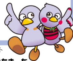
埼玉県マスコット コバトン&さいたまっち

★専門家のサポートを受けてみませんか。 共助社会づくり課【電話：048-830-2828】へお電話ください。