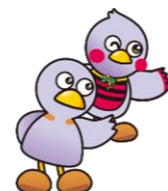
コバトン&さいたまっ