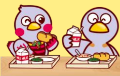
コバトン&さいたまっち